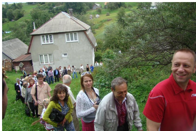
На фото: Ніби «тече» Родинна ріка...