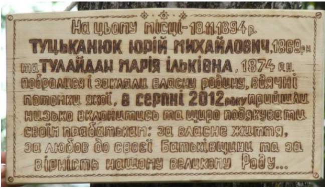
На фото: Пам'ятна Дошка з текстом, яку було розміщено на останній «дідовій» яблунці