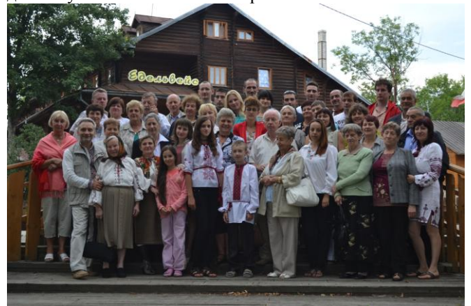
На фото: Родинне фото біля турбази «Едельвейс» - візитної картки туристичного Ясіня