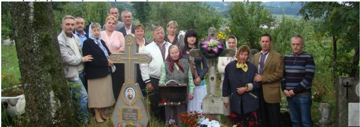
На фото: Відвідання кладовища та покладання квітів на могили, де поховані прабабки