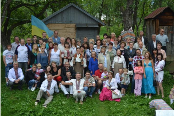
На фото: Члени Родини у Лопушанці, на родинному обійсті Туцканюків