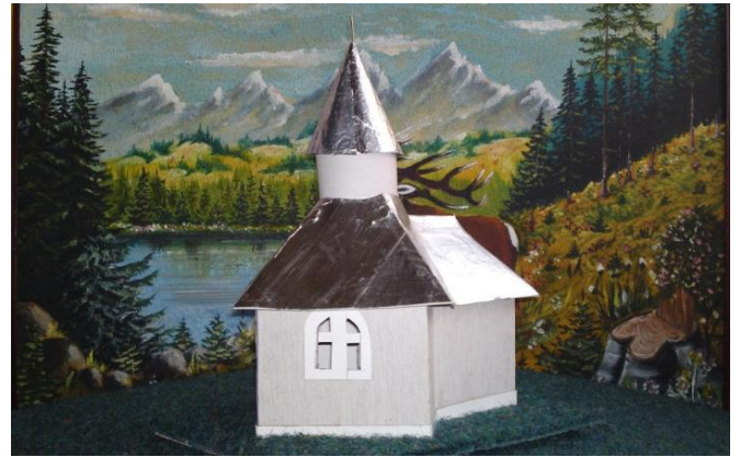
На фото: Макет Родинної Каплички, яку буде споруджено на родинному обійсті Туцканюків