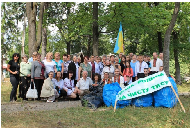
На фото: члени Родини після прибирання р. Тиси