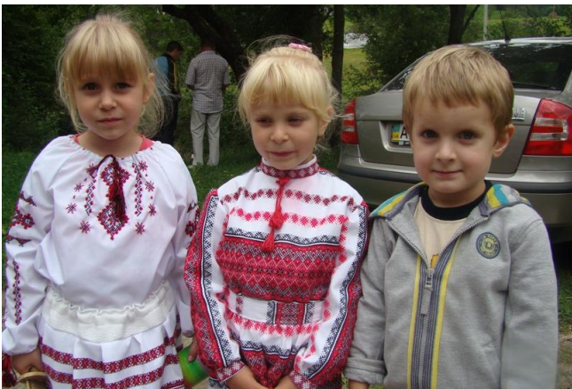
На фото: П'ятиюрідні сестрички та братик, як близнятка: одна з Ужгороду, друга з Лопушанки, третій з Мукачева