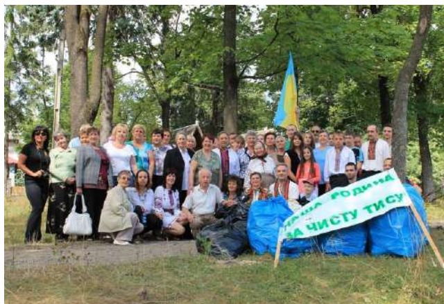
На фото: члени Родини після прибирання р. Тиси