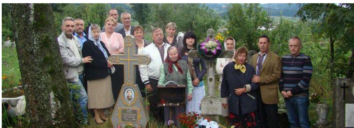
На фото: Відвідання кладовища та покладання квітів на могили, де поховані прабатьки

Ця стаття написана на подіях 2012 р. та побачила світ у Збірці наукових праць, краєзнавчих розвідок, рефератів і публіцистичних матеріалів за результатами I наукової конференції «Ясіня – столиця Гуцульської республіки... і не тільки», яка вийшла у видавництві «Сполом» (м. Львів), у 2013 році під назвою: «Ясіня у гомоні століть» (ISBN 978-966-665-864-0).