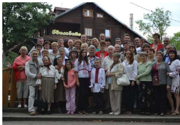
На фото: Родинне фото біля турбази «Едельвейс» - візитної картки туристичного Ясіня