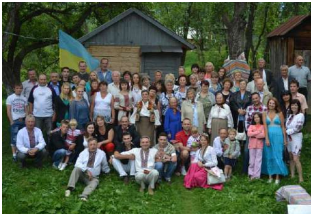
На фото: Члени Родини у Лопушанці, на родинному обійсті Туцканюків

«Рід, який не знає свого минулого – не має майбутнього» (народна мудрість)