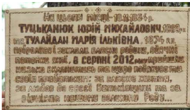
На фото: Пам'ятна Дошка з текстом, яку було розміщено на останній «дідовій» яблунці, в присілку Лопушанці, смт Ясіня, на Рахівщині