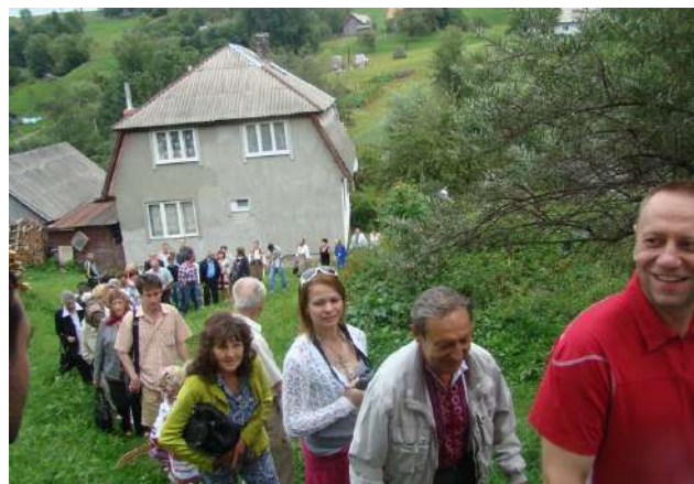
На фото: Ніби «тече» Родинна ріка...