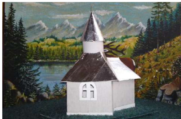
На фото: Макет Родинної Каплички, яку буде споруджено на родинному обійсті Туцканюків