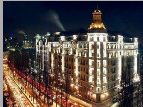
Отель «Премьер-Палац» 5**** , г.Киев, 2007