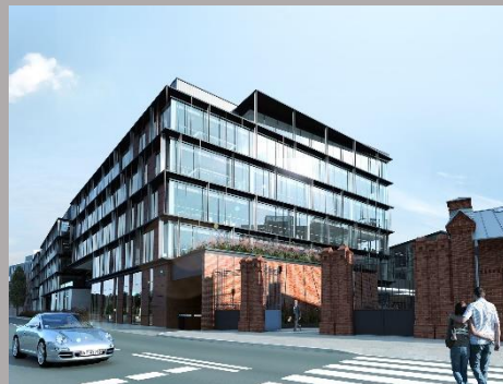
ЖК Варшава, Польша, 2018-2019