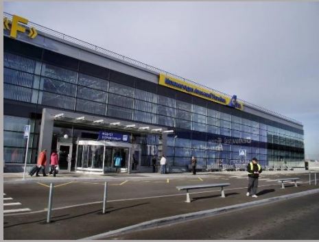
ГМ Аэропорт «Борисполь» , терминал «F»