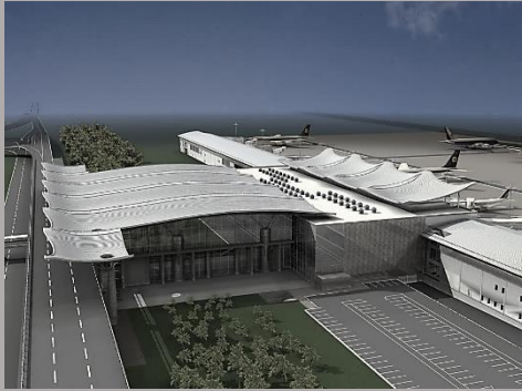
ГМ Аэропорт «Борисполь» , терминал «D»