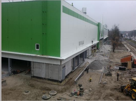
ТЦ «LEROY», г. Киев, пр-т Броварской, 2012-2013