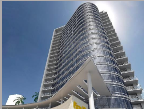
Бизнес-парк «Осокорки» , 2008