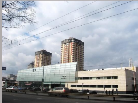
Автосалон "INFINITY" , г.Киев , пр-т Победы 134 , 2007