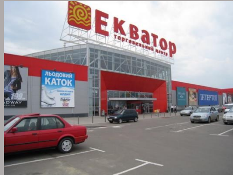
ТЦ «Экватор», г.Ровно, 2007