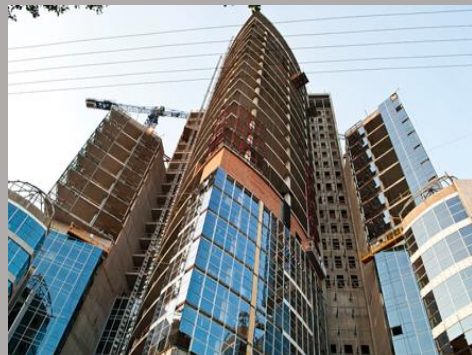
Отель «HILTON» с апартаментами , г.Киев , 2009-2012