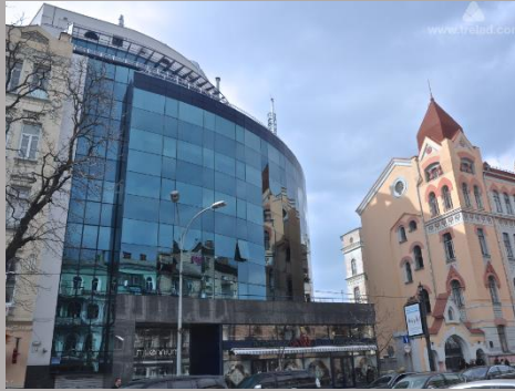
Реконструкция офисного центра "MILLENIUM" , г.Киев, ул.Владимирская 12 , 2009-2011