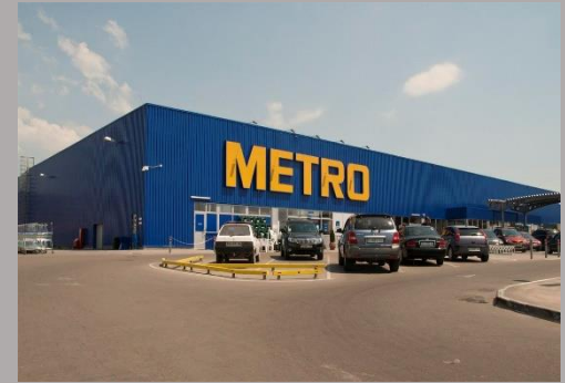
ТЦ «METRO» г.Ровно, 2007