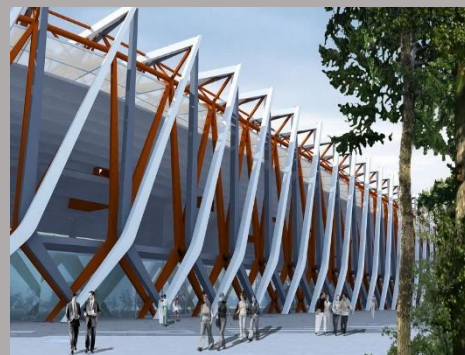
Стадион в Белостоке , Польша , 2011-2012