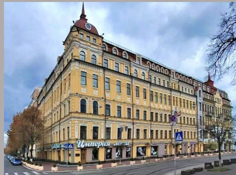
Бизнес-центр «Ильинский» , 2007-2008