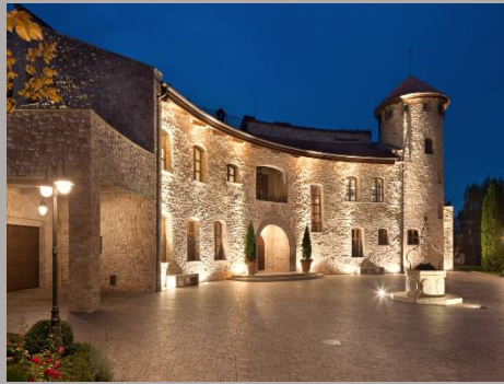
Жилой комплекс «Премиум», пгт Козин, 2012-2013