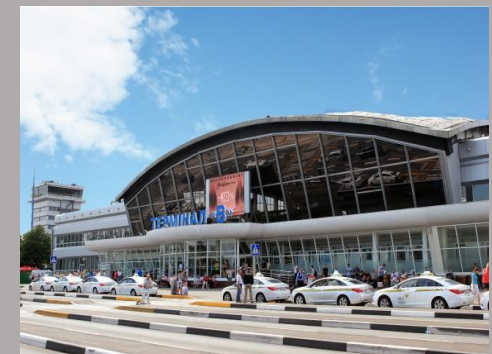
ГМ Аэропорт «Борисполь» , терминал «Б»