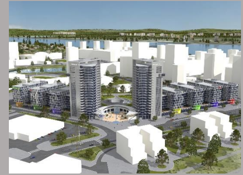
Бизнес-парк «Осокорки», 2008