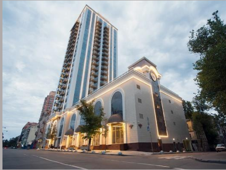
Клубный дом «Арт-Холл», 2011-2014