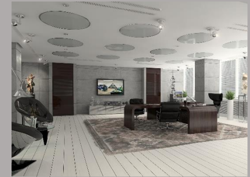
Реконструкция офисного центра "MILLENIUM" , г.Киев, ул.Владимирская 12 , 2009-2011