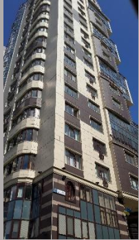
ЖК «Престиж-холл» по ул.Анри Барбюса 37/1 , г.Киев , 2007-2008