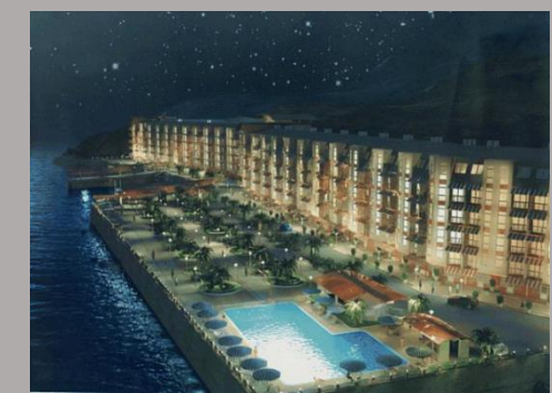
Апартаментный комплекс «Наутилус» пгт Гурзуф , 2011-2013