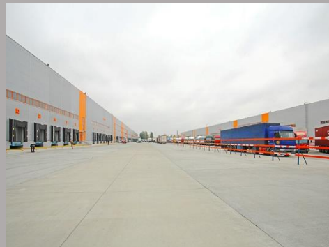
Торгово-складской комплекс «Чайка» , 2008-2009