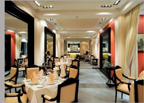
Отель «Премьер-Палац» , ресторан 8 –эт. , г.Киев , 2008