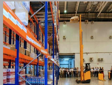
Торгово-складской комплекс «Чайка» , 2008-2009